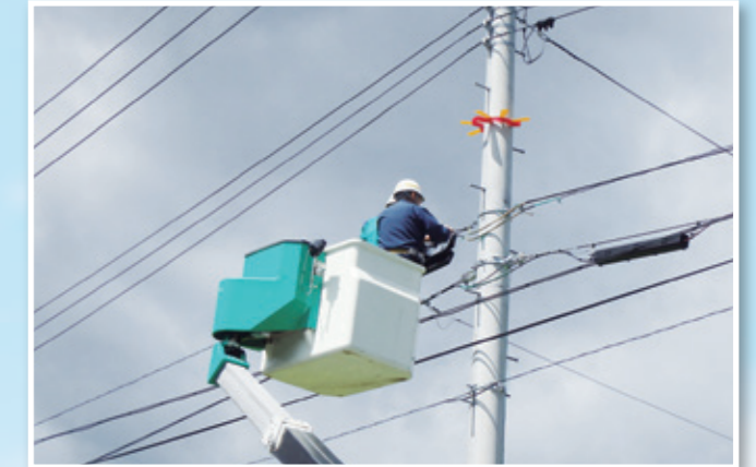
B 光ファイバケーブル接続