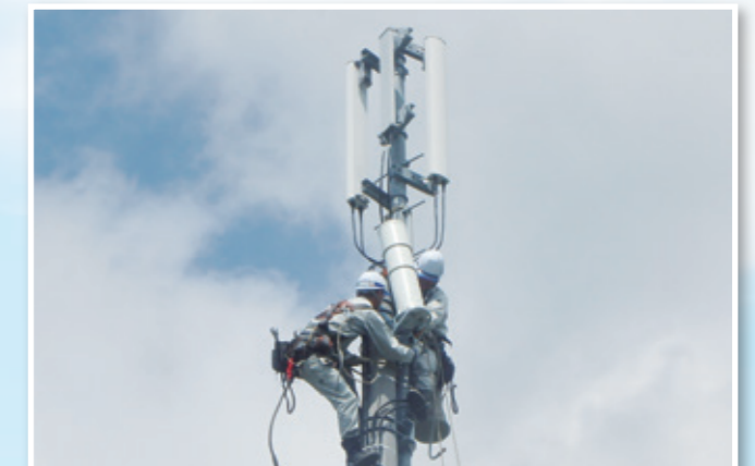
D 移動体通信アンテナ取付