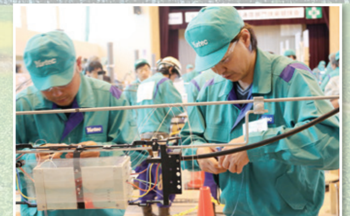
光ファイバケーブル心線接続競技