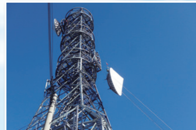
C 電力マイクロアンテナ取付