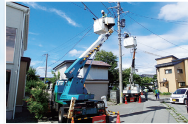
A 光ファイバケーブル布設