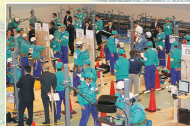
光通信回線復旧競技

本競技会は、通信サービスの主力通信媒体である「光ファイバケーブル」の工事における主要作業となる光ファイバ心線接続作業を「より早く、より正確に」を目指して、ユアテックとともに、持ち前の技術を発揮し、互いに切磋琢磨することと施工技術の交流を図ることを目的に開催されています。